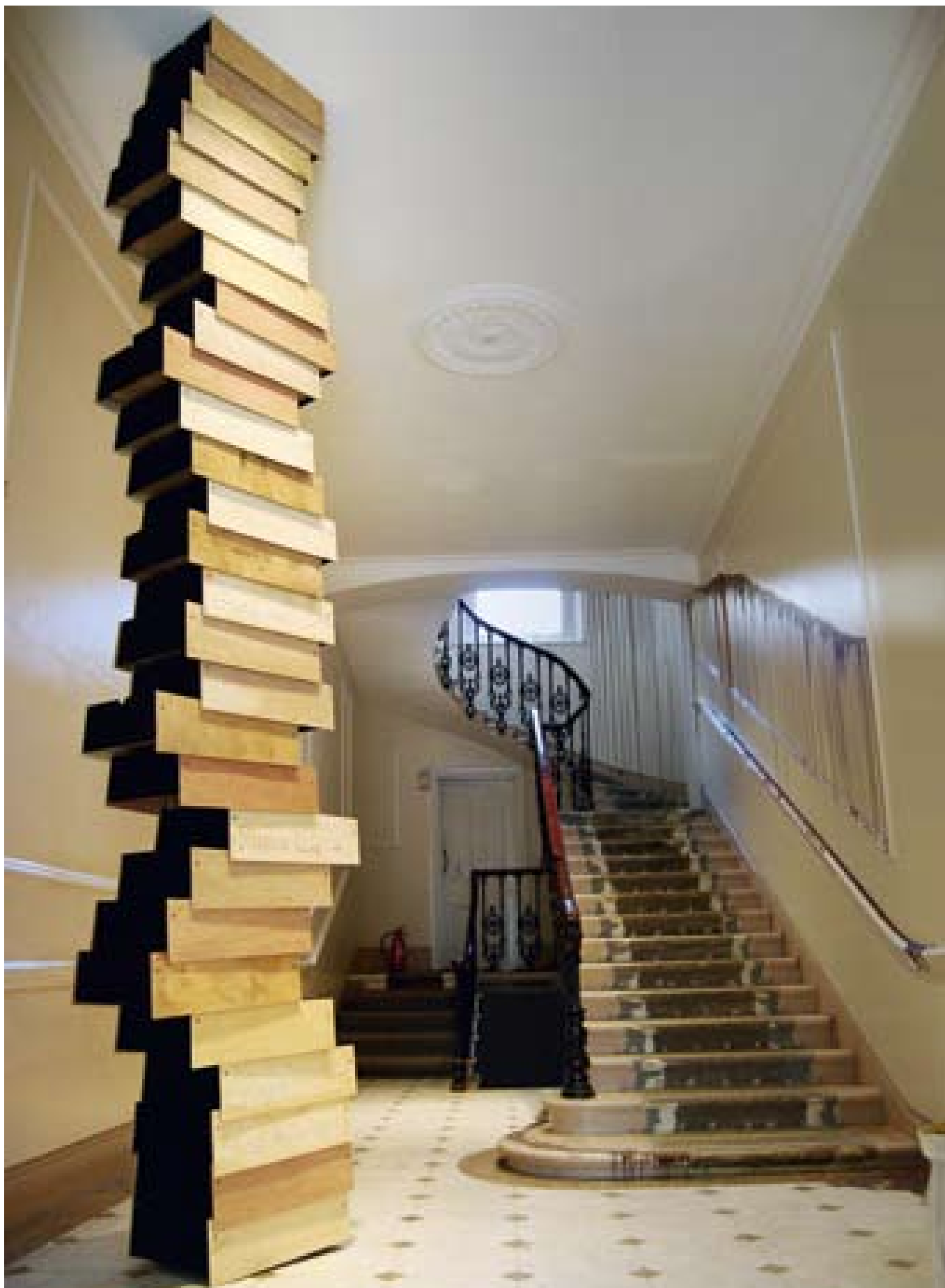
Prima versione di Stack, la pila di cassette mezzi aperti e senza montanti, prodotta da Established & Sons per il Salone del Mobile 2008.