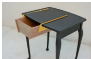
«Attache'z», entstanden aus einem alten Gestell.

RE Ich denke, wir glauben beide an Individualität, also dass die Menschen ihre persönlichen Interessen finden und pflegen sollten, während sie gleichzeitig ihre Umgebung, die soziale und natürliche, respektieren müssen. Wir glauben auch an Pluralismus, dass also zur gleichen Zeit und am gleichen Ort viele Ansätze und Bewegungen möglich sind, sei es in der Musik, Mode oder im Design. Genau dies geschieht in diesen Tagen in London und vermutlich auch an anderen Orten. Auf der politischen Ebene wünschte ich mir, dass irgendwann in der Zukunft die ganze Welt ein einziges Land ist, so wie in Europa, wo es zwar noch verschiedene Sprachen und Klimazonen gibt, aber niemand mehr über Grenzen oder Reisebürokratie wie Visa oder Arbeitsbewilligungen spricht.